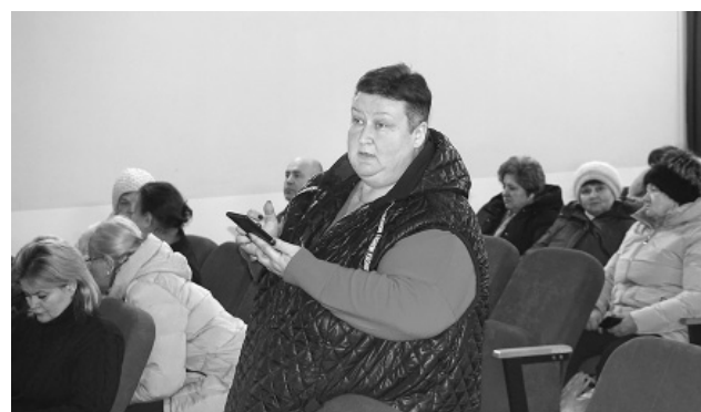
Вопрос от жителей Карачихи