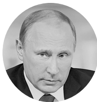
Глава государства Владимир Путин:

“ За последние годы удалось существенно укрепить первичное звено здравоохранения. Были построены новые и оснащены существующие поликлиники и районные больницы.